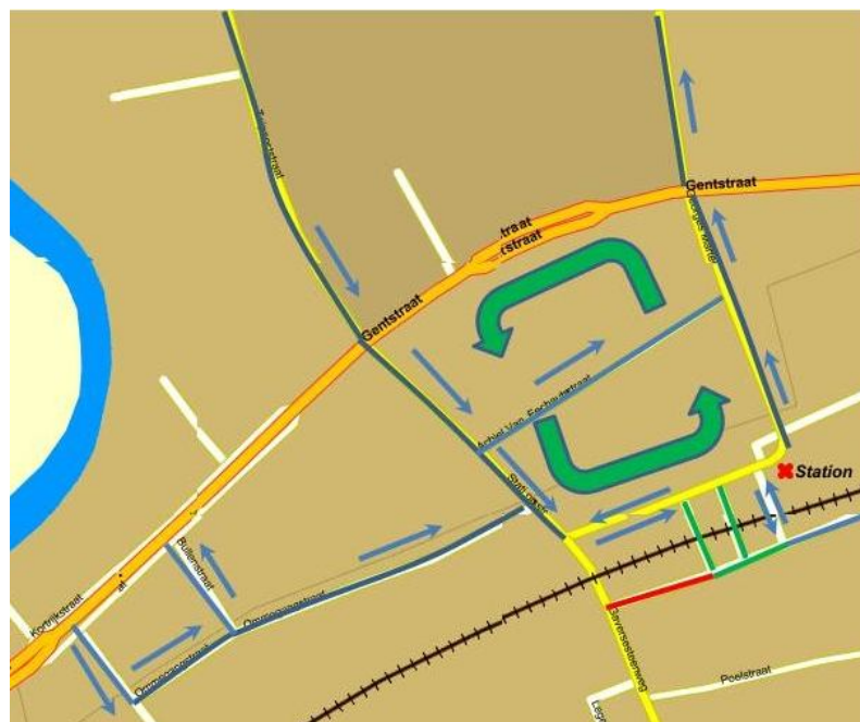
Figuur 2: Nieuwe inrichting N43 en stationsbuurt. Alle blauwe straten worden éénrichtingsverkeer (richting aangeduid met blauwe pijl), de rode straten zijn voorbehouden aan fietsers en voetgangers, de groene zijn enkel voor de bussen.

Probleem b kan enkel opgelost worden door het verkeer dat van de G. Gezellelaan komt (en naar rechts gaat) te vermijden waardoor het verkeer tussen de verkeerslichten minder stropt. Dat bereiken we door de G. Gezellelaan éénrichtingsverkeer te maken van het kruispunt N43 naar de Oostmeersdreef toe (zie Figuur 2). Er komt dan op het kruispunt N43/G. Gezellelaan enkel nog verkeer toe van de N43 en van de G. Martensstraat (van het station). Dat laatste verkeer is vooral verkeer dat rechts afslaat (richting Astene) en rechtdoor rijdt en verhoogt dus het fileprobleem naar de Knok toe niet (dat verkeer kan best via de Gaversesteenweg en Volhardingslaan rijden). Hierdoor zullen de files vanuit Astene korter worden (oplossing knelpunt 1).