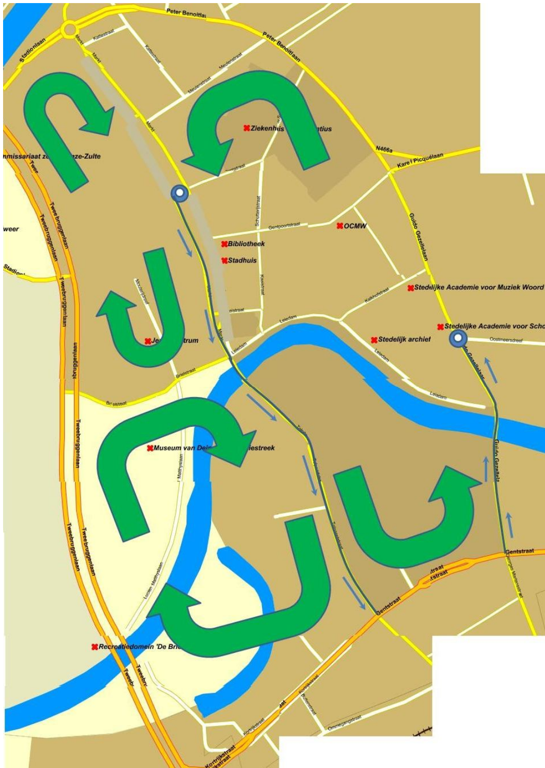
Figuur 5: het verkeer in het centrum verloopt volgens drie grote lussen. Blauwe straten zijn éénrichtingsverkeer volgens de richting aangeduid met de blauwe pijl.