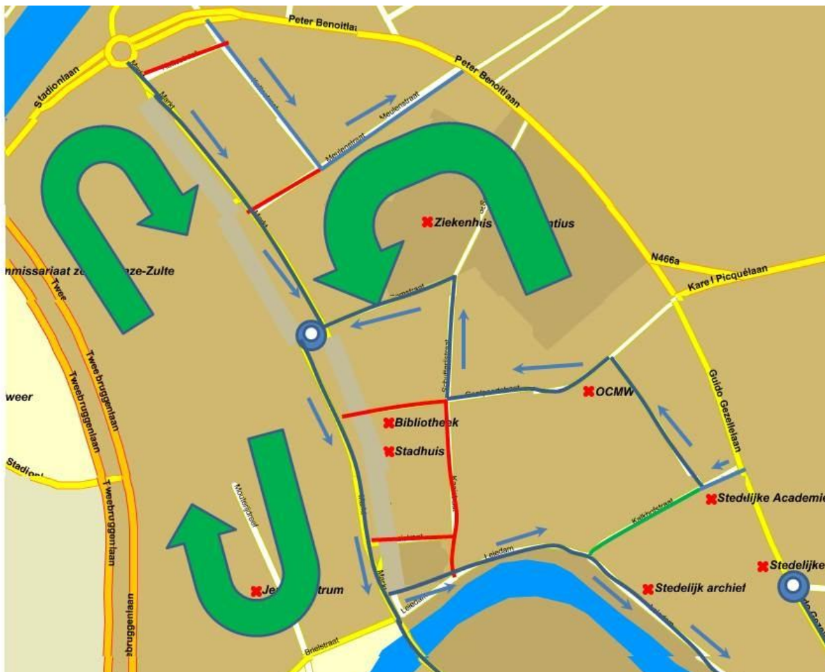
Figuur 6: Voorstel voor het centrum. Alle blauwe straten worden éénrichtingsverkeer (richting aangeduid met blauwe pijl), de rode straten zijn voorbehouden aan fietsers en voetgangers, de groene zijn enkel voor de pendelbus.