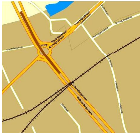
Figuur 4: Overbrugging van het rond punt in Petegem voor de twee middelste rijvakken (in bruine kleur).

Om de verzadiging van het rond punt op het kruispunt N43/N35 tegen te gaan (knelpunt 2 – files aan het rond punt in Petegem), kan er (op langere termijn) gedacht worden aan een overbrugging van het rond punt voor het doorgaand verkeer op de N35 (zie Figuur ). Dit kan perfect door de twee middelste baanvakken op de Volhardingslaan los te koppelen en op de brug over het rond punt te leiden voor het doorgaand verkeer. Bestemmingsverkeer naar de N43 kan dan de buitenste baanvakken blijven gebruiken, zoals nu (dit lost ook knelpunt 2 – files aan rond punt – op). Een alternatief zou ook een ondertunneling zijn maar een brug zal goedkoper zijn en technisch haalbaarder omdat ze kan aansluiten op de brug over de Leie (voor een tunnel zouden de auto's van de brug meteen een tunnel moeten induiken en hiervoor is misschien niet genoeg plaats).